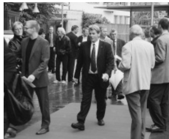
Die FDP rollt der Wirtschaft anlässlich des ersten Worber Wirtschaftsapéros den roten Teppich aus. Weiter Seite 2